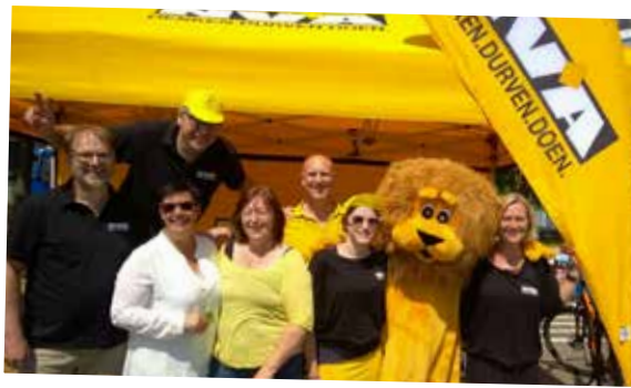
▲ N-VA Kortenberg heeft de Vlaamse feestdag uitgebreid gevierd.

Het begon met een passage op de donderdagmarkt, waar we de marktbezoekers een hapje en een drankje aanboden, en waar ook de ‘Vlaanderen op Kop’-petjes veel succes kenden. Hoogtepunt van onze acties was de tocht met de N-VA-ijskar door Groot-Kortenberg. Extra gesteund door het mooie weer trakteerden we honderden Kortenbergenaars op een ijsje. En zelfs de motorpech van onze oldtimer stond het plezier niet in de weg. Op 11 juli zelf bezorgden we tientallen vlaggende Kortenbergenaars tot slot een bedankje.