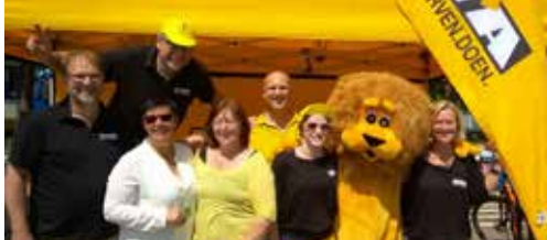
Geslaagde Vlaamse feestdag in Kortenberg p. 2