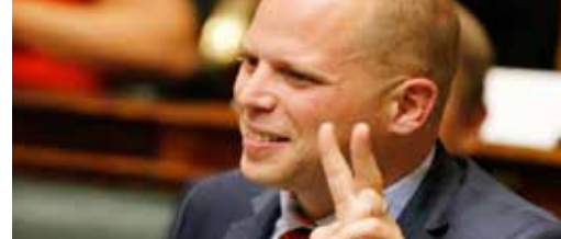
Theo Francken komt naar Kortenberg p. 3