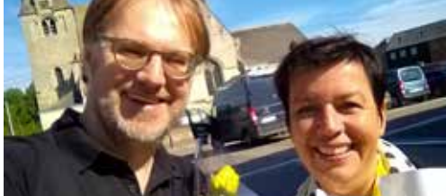
N-VA viert moeder p. 2