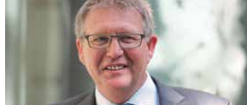
Dossier luchthaven Zaventem p. 3